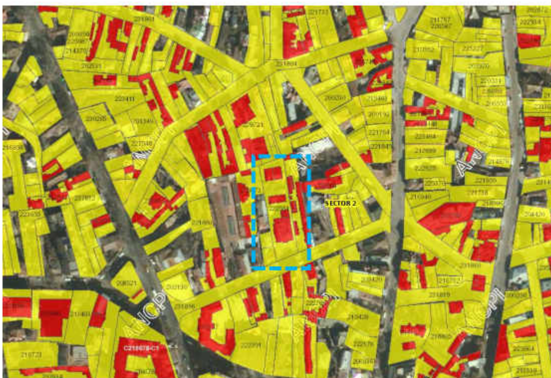
Extras din Încadrare în Imobile E-terra