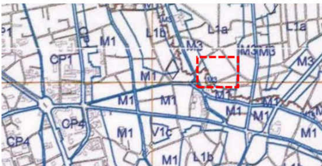
Extras din PUG Bucuresti, aprobat prin HCL nr 269/2000

Terenul aflat în Strada Leonida nr 19 se află conform PUG Municipiul București în zona L1a - locuințe individuale și colective mici cu maxim P+2 niveluri situate în afara perimetrelor de protecție.