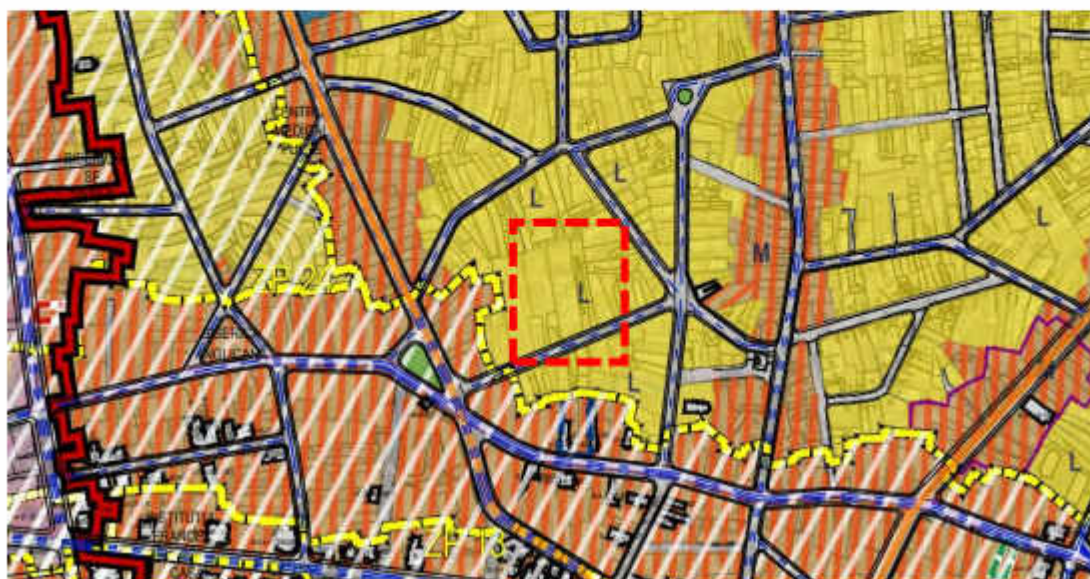
Extras din Informarea Populației, Etapa II – Elaborarea Propunerilor

Încadrarea terenului de la adresa Strada Leonida nr 19 este: